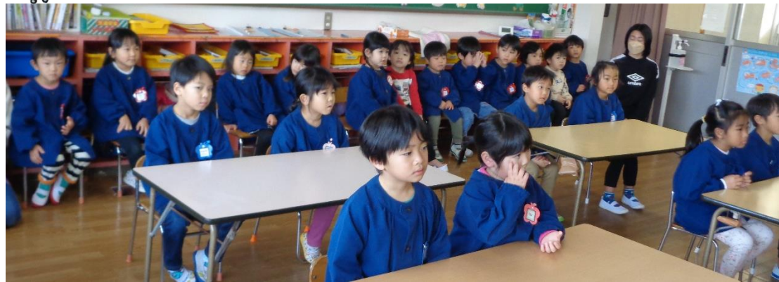
真剣な表情でしっかりお話を聞くことができました。